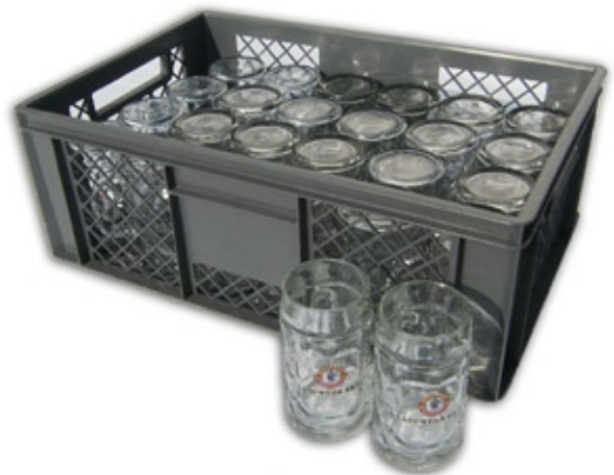
1300 Festkrug 0,5 Liter, Korb à 24 Stück